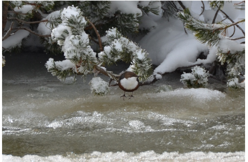
Wasseramsel auf Nahrungssuche

Mit dem nachfolgenden Gedanken vom Dichter Antoine de Saint Exupéry möchte ich uns dennoch zu einer guten Einstellung auf das neue Jahr einstimmen.