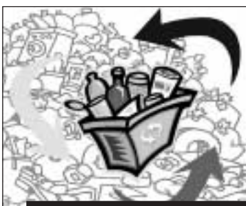
La gestion des déchets: elle n'est possible qu'avec l'aide des citoyens.