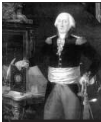
Portrait de Louis d'Affry, premier landammann de la Suisse, par Joseph de Landerset (1807). [MAHF]

La période de la Médiation revêt également une importance considérable pour Fribourg, tant sur le plan politique qu'administratif. Issue de l' Acte de Médiation , la Constitution fribourgeoise de 1803 crée notamment un Grand Conseil de 60 membres, douze districts, et