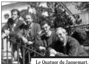
Le Quatuor du Jaquemart.