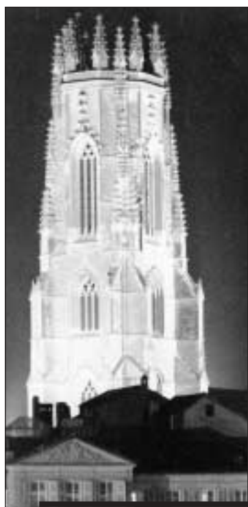
La cathédrale de Fribourg illuminée.

Belle de jour, mais peut-être encore plus belle de nuit, la cathédrale est à nouveau éclairée, depuis la fête de la Saint-Nicolas, grâce à une nouvelle installation qui souligne les lignes majeures de notre plus bel édifice gothique.