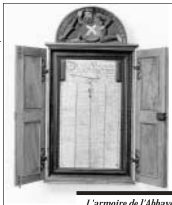
L'armoire de l'Abbaye des Tanneurs.

Musée d'art et d'histoire (MAHF), rue de Morat 12, 1700 Fribourg. Tél.: 026 305 51 40 – Site internet: www.fr.ch/mahf