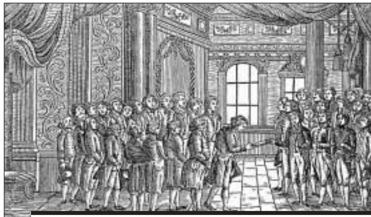
Übergabe der Mediationsakte an die Schweizer Delegierten am 19. Februar 1803.

Um die neue politische Ordnung effektiv und friedlich, unter Abstimmung mit den französischen Interessen, in der Schweiz einzuführen und die Integration der sechs neuen Kantone, früheren Untertanengebieten (AG, TI, TG, VD) oder alten Bundesgenossen (GR, SG), voranzutreiben, ernannte Bonaparte den Freiburger Louis-