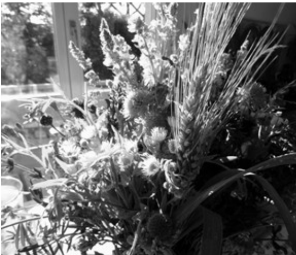
Einen bunten Strauss wertvoller Tipps gibt es auf: www.energie-umwelt.ch .

So trocken die Webseite tönt – Informationsplattform der Fachstellen für Energie und Umwelt der Westschweizer Kantone – so praktisch sind die über 500 Tipps für fast alle Lebensbereiche. Neu aufgeschaltet worden ist ein überarbeiteter Mobilitätsrechner mit dem «zeitgemässen» Namen Mobility-Impact 2.0 . Damit können Sie für verschiedene Verkehrsmittel die Route, den Energieverbrauch und die Abgasemissionen ermitteln und vergleichen. Zur Auswahl steht eine breite Palette von Parametern wie Anzahl der Fahrgäste, Gepäckträger bzw. Dachbox auf dem Autodach, Herkunft der Elektrizität, sparsames Fahren, Fahrzeugkategorie etc. Bei den Verkehrsmitteln gibt's gar die Option Helikopter... Jedenfalls lohnt sich ein Ausflug auf www.energie-umwelt.ch .