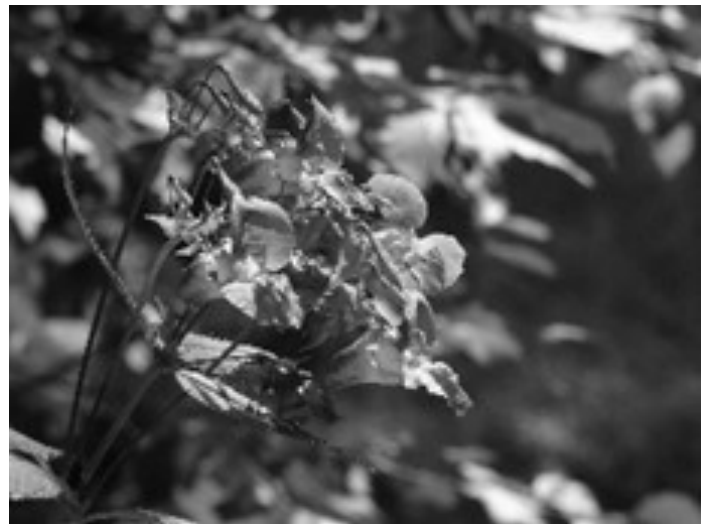
Manche Blumen sind nicht nur schön, sondern leider auch invasiv wie das Drüsige Springkraut.