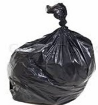
Müllsack mit vollen Pampers

Es war ein rundum gelungener Tag mit vielen nachhaltigen Eindrücken. Ein Schüler hat es wohl sehr treffend gesagt «Mir si keni Souniggle – mir si e suberi Gmeind». Ein wunderbarer Satz wie wir meinen.