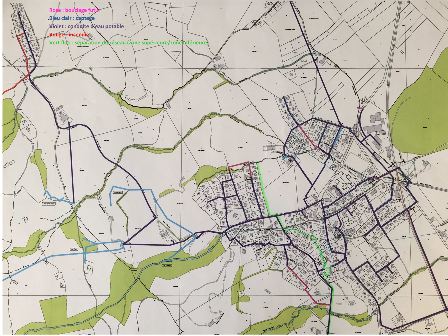
Carte du village avec indication des zones (art. p. 5)