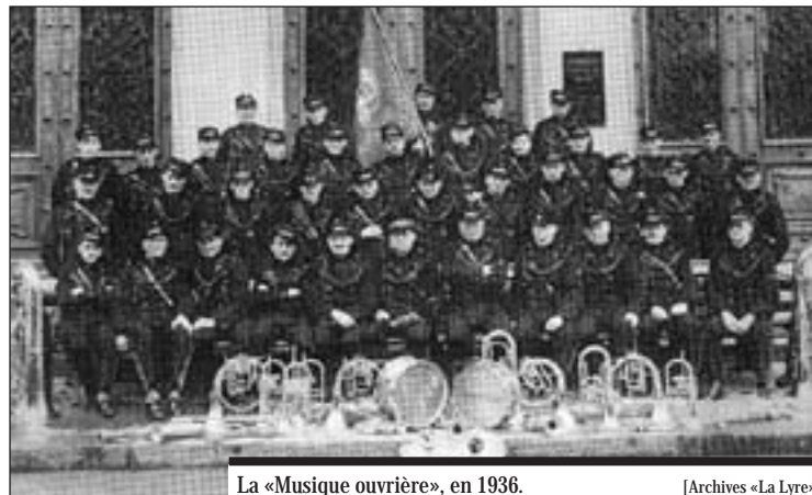
La «Musique ouvrière», en 1936.