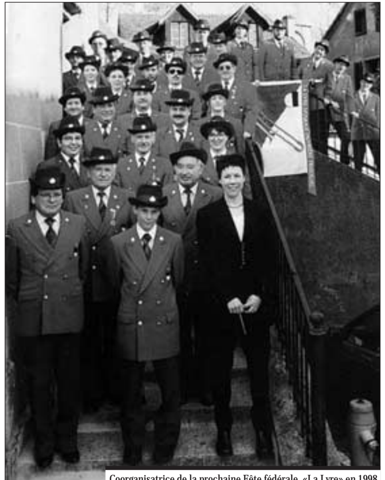
Coorganisatrice de la prochaine Fête fédérale, «La Lyre» en 1998, à l'occasion de son 75 e anniversaire.