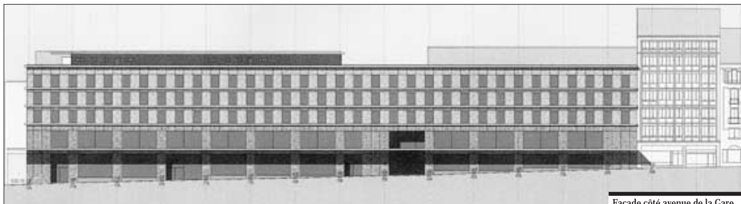
Façade côté avenue de la Gare.

L'ensemble construit représente environ 150 000 m 3 SIA, comptant 28 000 m 2 de surface brute de plancher sur 7 niveaux hors terre et 6 sous terre, répartis en locaux commerciaux, administratifs, en habitation, en dépôts et en parking, conformément au plan d'aménagement de détail et au permis de construire. L'achèvement de cet ensemble immobilier est envisagé dans le courant de l'année 2003.