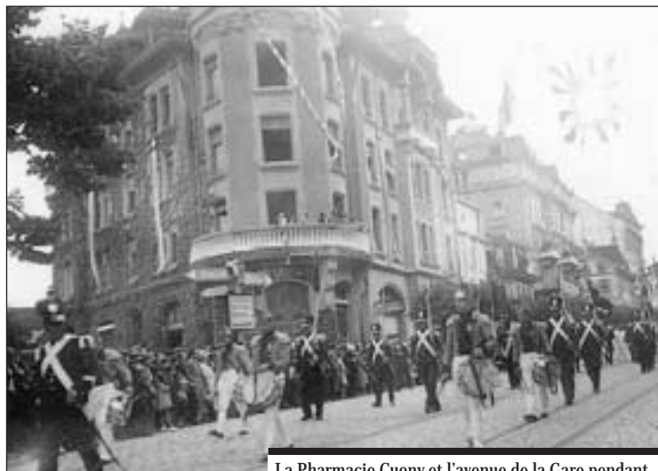
La Pharmacie Cuony et l'avenue de la Gare pendant le cortège du Tir fédéral de 1934. [Doc. AVF / E. Maillard]

Dix propriétaires étaient concernés par des parcelles réparties géographiquement en deux secteurs : le secteur A et C et le secteur B. Elles ont fait l'objet d'un plan d'aménagement de détail (PAD) qui, en vertu de la loi du 9 mai 1983 sur l'aménagement du territoire et les constructions (LATeC), devait nécessairement compléter le plan d'aménagement