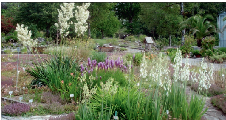
Le secteur des géophytes.

A travers des manifestations, le Jardin botanique partage ses connaissances et donne au public le goût des plantes et de la nature. « Les jardins botaniques ont gardé ce lien avec la terre. Le savoir était transmis de manière orale mais cela s'est perdu pendant une ou deux générations. » Le 1,8 hectare du jardin montre ce que la nature a à offrir, des plantes médicinales à celles carnivores ou menacées, en passant par la roseraie et les plantes tropicales.