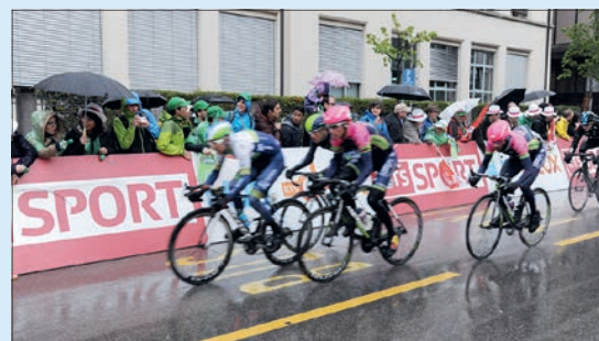
En 2015, Fribourg avait accueilli une arrivée d'étape.

Plus d'informations: www.etapefribourg.ch