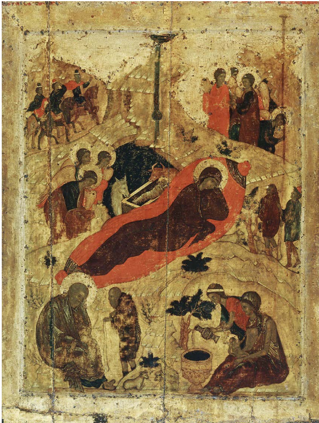
Nativité. Début du XVe siècle. Icône attribuée à Andrei Roubliov. Cathédrale de l'Annonciation, Moscou

Le Conseil communal vous souhaite de bonnes fêtes de Noël et une heureuse Nouvelle année!