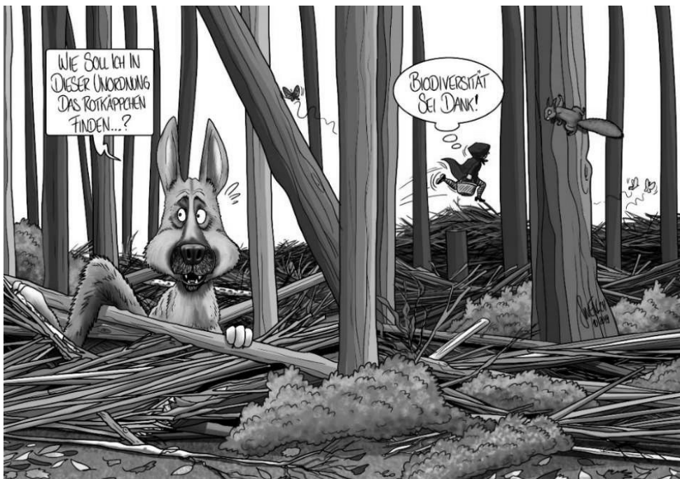
Mehr als 40 Prozent der bei uns vorkommenden Tiere und Pflanzen sind auf den Wald als Lebensraum angewiesen. Asthaufen spielen dabei eine wichtige Rolle. Cartoon: Silvan Wegmann

Über 40 Prozent der bei uns vorkommenden Tiere und Pflanzen sind auf den Wald als Lebensraum angewiesen – gut 25'000 Arten! Auch die Vögel profitieren vom naturnahen Waldbau. Gemäss Vogelwarte Sempach hat der Bestand der Waldvögel seit 1990 um 20 Prozent zugenommen. Asthaufen begünstigen übrigens die Ausbreitung von Borkenkäfern nicht. Unsere häufigsten Borkenkäferarten mögen keine dünnen Äste, weil diese unter der Rinde zu wenig Platz für die Brutstube bieten und viel zu schnell austrocknen. Zudem beobachten Förster und Waldeigentümer die Situation laufend.