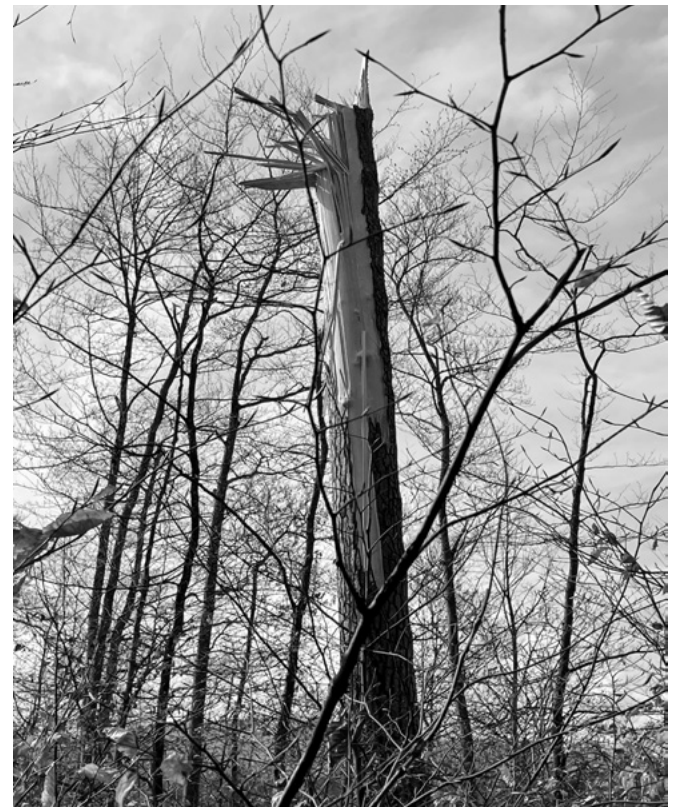
Ein durch Windböen zerstörter Baum

In unserer Gemeinde gibt es viel schöne Natur und wunderbare Wandermöglichkeiten. Der Aufenthalt im Freien ist ausser bei ungewöhnlichen Wetterlagen problemlos. Die Gemeinde setzt sich für den Schutz und den weiteren Ausbau der Wanderwege und Langsamverkehrsachsen ein.