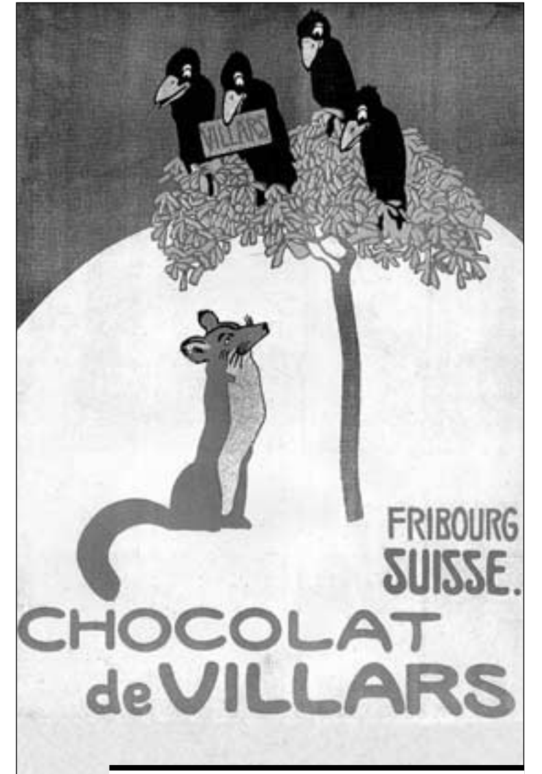
«Les corbeaux et le renard», une composition publicitaire des années 1910, réalisée par E. Cardinaux.