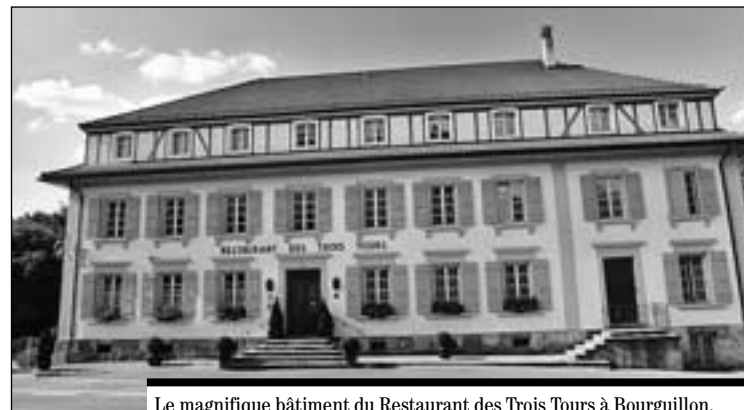
Le magnifique bâtiment du Restaurant des Trois Tours à Bourguillon.

vert à Marly. Quatre ans plus tard, il ne laisse pas passer la possibilité d'acquérir le bâtiment des Trois Tours à Bourguillon et il y emménage. Non seulement le restaurant y est plus spacieux, mais la maison possède encore différentes salles. Au rez-de-chaussée, deux salles permettent de servir entre 40 et 50 couverts, et la salle des Palmiers, réservée aux banquets, compte environ 80 places. La terrasse, sans doute offre un havre de paix, à deux pas de la ville, aux 40 ou 50 clients qui peuvent y prendre place, aux beaux jours. A signaler, en outre, un magnifique caveau qui accueille régulièrement les amateurs de jazz.