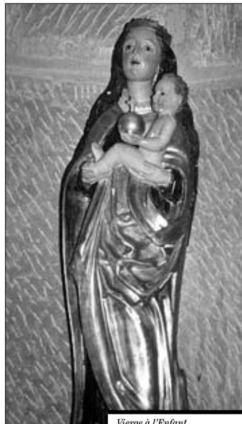
Vierge à l'Enfant.

Ces deux statues avaient été déplacées au Home bourgeois au