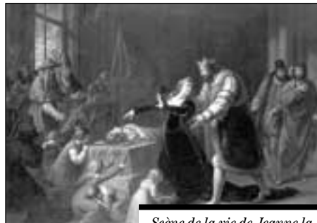
Scène de la vie de Jeanne la Folle , d'Anton Petter, 1878.

La vie tourmentée de Jeanne la Folle n'a cessé de fasciner les artistes. L'exemple choisi démontre le goût prononcé du XIX e siècle pour la mise en scène dramatique et la représentation théâtrale de ce tragique destin.