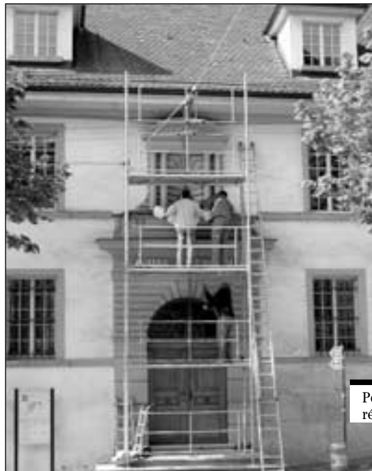
Pendant les travaux de réinstallation.

moment de la rénovation de l'ancien Hôpital des Bourgeois, vraisemblablement pour des raisons de sécurité.