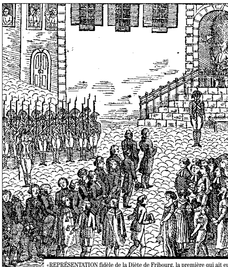
«REPRÉSENTATION fidèle de la Diète de Fribourg, la première qui ait eu lieu en Suisse depuis l'acte de médiation. On y voit le corps des députés des cantons à la Diète, se rendant à l'hôtel de ville... A gauche se trouve un corps d'infanterie, et à droite des spectateurs de tout âge, sexe et condition.»

– a déposé un recours contre la décision du Conseil général de conclure une convention avec l'Ecole libre publique visant à autoriser la scolarisation à l'école régionale allemande des enfants domiciliés dans un périmètre restreint.