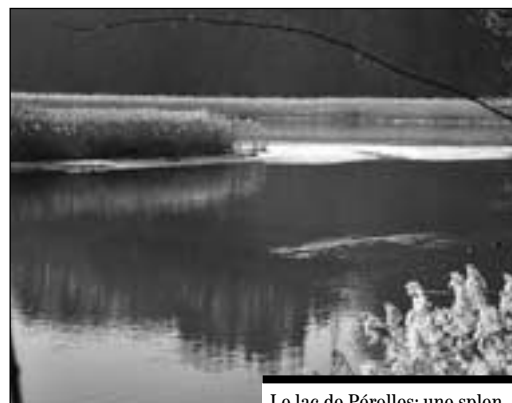
Le lac de Pérolles: une splendeur de la nature à protéger.

Le dossier du plan de gestion du lac de Pérolles peut être consulté au Service de l'aménagement de la Ville de Fribourg, rue Joseph-Piller 7 (s'adresser à la réception).