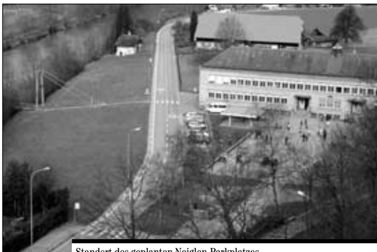
Standort des geplanten Neiglen-Parkplatzes.

Der Ersatz von zwei Servern und die Verdoppelung des Datensicherungssystems beanspruchen 220 000 Franken. Mehrere Institutionen planen, mit vereinten Kräften in der Stadt Freiburg ein Glasfasernetz einzurichten: das kantonale Informatikzentrum, die Universität, Cablecom, die FEW und die Gemeinde. Für die Beteiligung der letzteren an diesem gemeinsamen Projekt «Frinet» sind 200 000 Franken budgetiert.