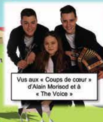
Vus aux « Coups de cœur » d'Alain Morisod et à « The Voice »

Plus d'informations : www.alpage2019.org