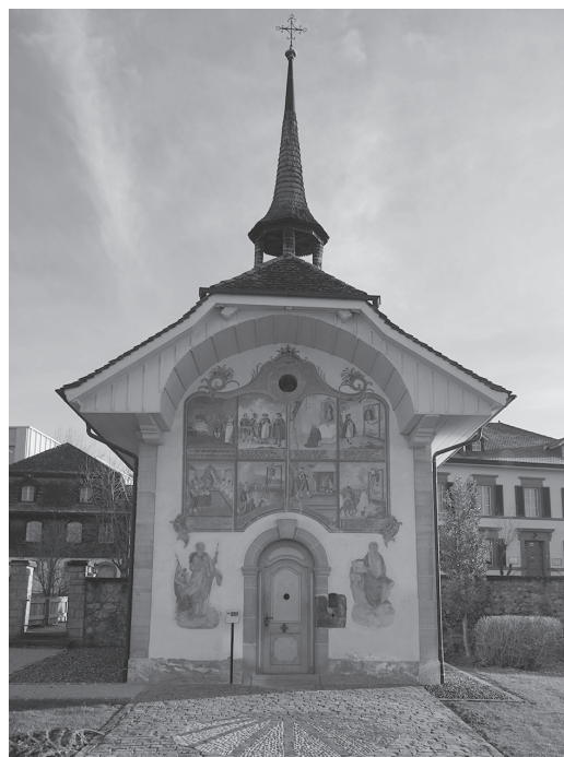
Jakobs- kapelle in Tafers.