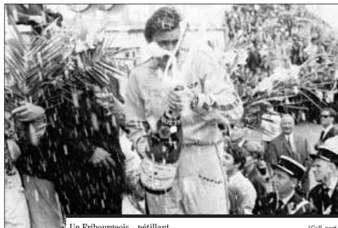
Un Fribourgeois... pétillant.