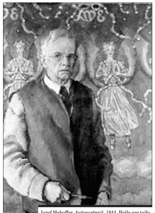
Jozef Mehoffer, Autoportrait , 1944. Huile sur toile, 97 × 68 cm.

Musée d'art et d'histoire Fribourg (MAHF), rue de Morat 12, 1700 Fribourg Tél. 026 305 51 40 / www.fr.ch/mahf