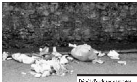
Dépôt d'ordures sauvages.

Ce sont là les principales raisons qui amènent à interdire ces pratiques et à les sanctionner.