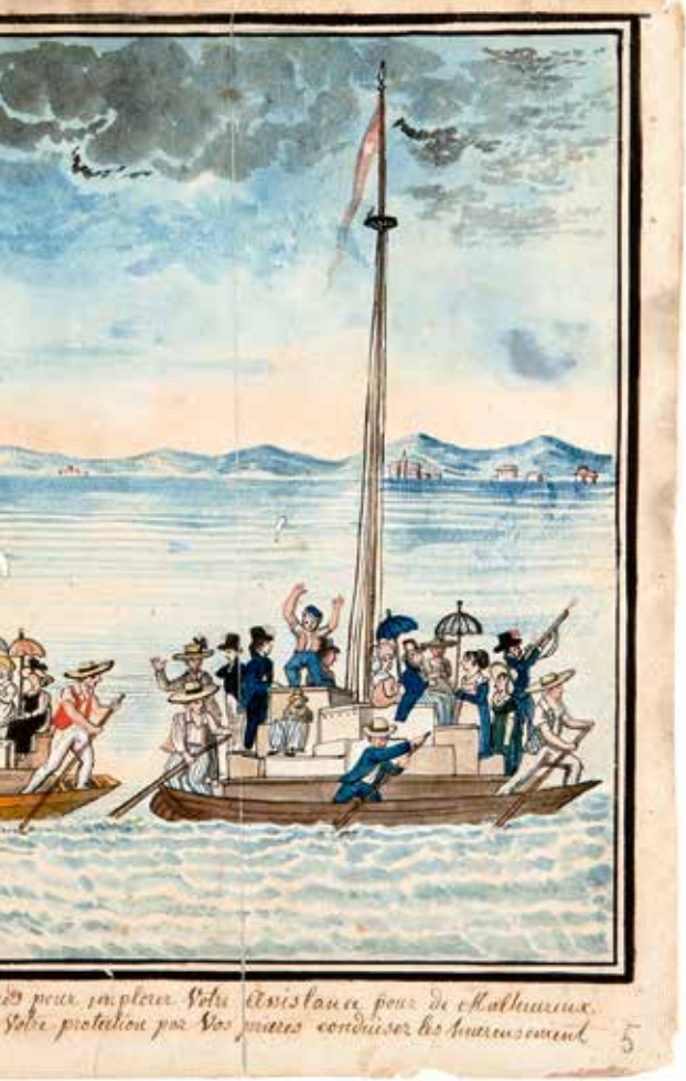
Départ des Fribourgeois depuis Estavayer, sous la protection de la Vierge à l'Enfant

des escrocs et s'ils ont obtenu 395 livres et 8 batz «pour aller au Brésil», il laisse «le soin au Conseil communal de se récupérer comme mieux il lui conviendra».