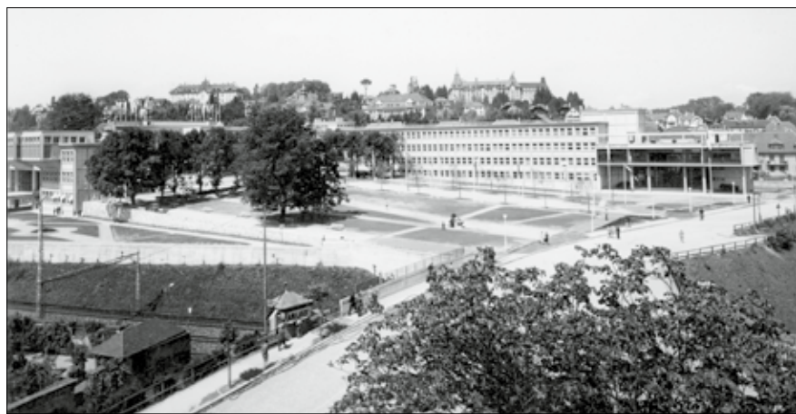
L'Université de Fribourg site Miséricorde autour de 1945

Au cœur du site s'élève le bâtiment des services généraux avec l'aula, s'ouvrant sur le hall d'honneur, le Rectorat et le Sénat, notamment, à l'étage. Son architecture est classique pour souligner le prestige de l'édifice. Pour marquer son caractère central, les trois allées du parc convergent vers lui. L'aile nord héberge des salles de séminaires aux dimensions restreintes. Elle s'ouvre sur le parc et sur le centre-ville, une manière de montrer l'Université comme un pont vers la ville. Du côté route du Jura se trouve le groupe de l'accueil, comprenant la chapelle au parterre et, à l'étage supérieur en porte-à-faux, la salle de lecture et la cafétéria. Il joue un rôle représentatif, l'entrée porte d'amples baies et de somptueux motifs en fer forgé. Son toit est aménagé comme terrasse. De l'autre côté, l'aile se termine par l'élégant pavillon de musicologie. Au sud, le long de la voie ferrée, l'aile des cours se dis-