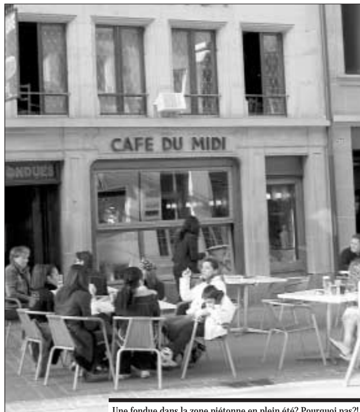
Une fondue dans la zone piétonne en plein été? Pourquoi pas!?

Le restaurant compte 140 places sur deux étages, la terrasse pouvant accueillir 50 personnes.