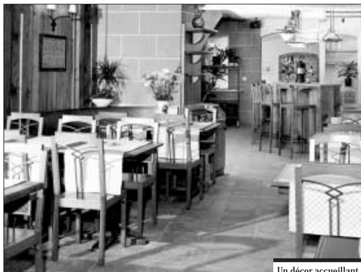
Un décor accueillant.

L'existence de la fondue remonte au XVII e siècle, en plein essor de la production et du commerce fromagers. Elle serait née un soir d'hiver, quelque part là-haut sur la montagne, où les seuls vivres alors disponibles étaient le fromage, le pain et le vin... Au XIX e siècle, la fondue est promue «plat national» et devient très à la mode. Mais c'est surtout à partir des années 1930, grâce à la publicité financée par l'Union suisse du commerce de fromage, qu'elle prend véritablement son envol. En 1940, elle dévoile ses attraits au monde entier lors de l'Exposition universelle de New York. Cette année-là, elle conquiert également Paris avec le grand succès que l'on sait.