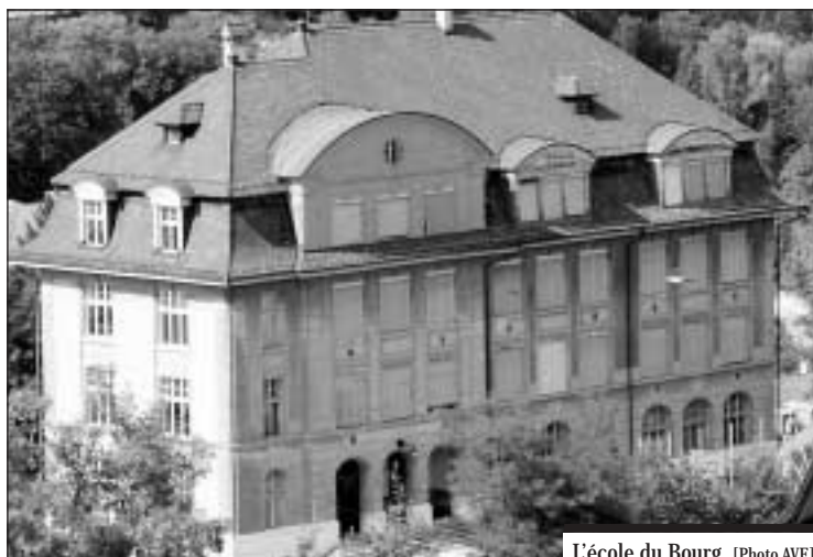
L'école du Bourg.

400 000 francs sont affectés à l'aménagement d'un giratoire au carrefour route de Villars - route de Bertigny , sis en dessous de l'Hôpital cantonal. L'insertion des véhicules sortant de la route de Bertigny sur la route de Villars en sera grandement facilitée. Le dispositif permet de modérer la vitesse des véhicules entrant en ville et de réserver une voie de bus jusqu'au giratoire du Belvédère. 65 000 francs sont desti-