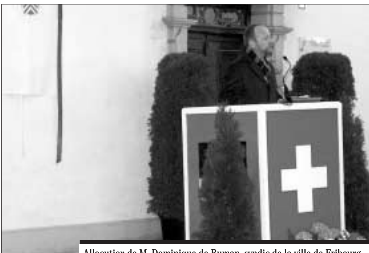
Allocation de M. Dominique de Buman, syndic de la ville de Fribourg.

du Deutscher Geschichtsforscher Verein des Kantons Freiburg. Cet hommage, organisé conjointement par les Archives de la Ville et de l'Etat de Fribourg, a rassemblé un large public et a été agrémenté par La Concordia, Corps de musique officiel de la Ville de Fribourg.