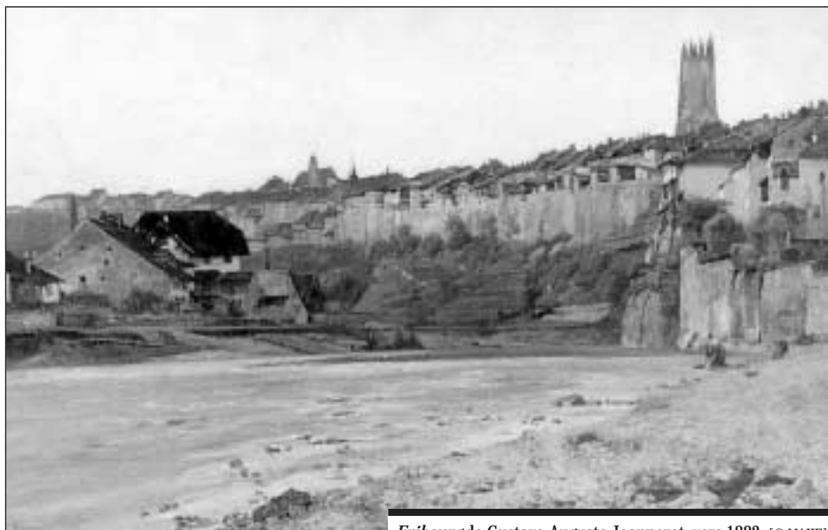
Fribourg de Gustave-Auguste Jeanneret, vers 1882.

Musée d'art et d'histoire (MAHF), rue de Morat 12, 1700 Fribourg. www.fr.ch/mahf