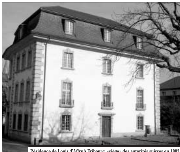
Résidence de Louis d'Affry à Fribourg, «siège» des autorités suisses en 1803.