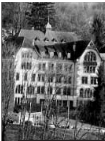
Die Villa-Thérèse-Schule.

Die Industriellen Betriebe investieren im Rahmen des Ausbaus des Wasserleitungsnetzes : 230 000 Franken in Leitungen an der Saint-Barthélemystrasse und 300 000 Franken in das Teilstück Palatinat-ARA .