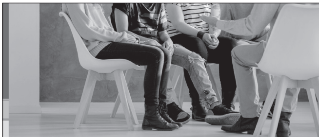
Infoabend: Selbsthilfegruppe für Suchtbetroffene