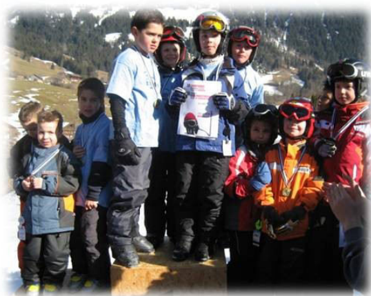
Notre équipe d'Auboranges sur le podium

Samedi 23 février 2008, des élèves de la classe 1P de Rue, 2P d'Auboranges, 3/4P de Chapelle et 5/6P d'Ecublens ont participé au 20 ème championnat fribourgeois scolaire de ski et de snowboard, initialement prévu à Rathvel, mais déplacé sur les pistes de Jaun pour des raisons d'enneigement.