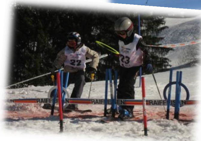
Jeu d'adresse à mi-parcours