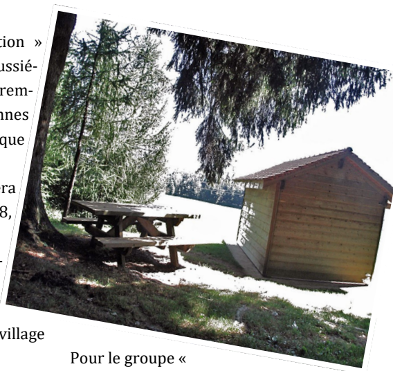
Pour le groupe « animation » d'Agenda 21

A la mi-juin, un tout-ménage vous communiquera les informations de dernières minutes.