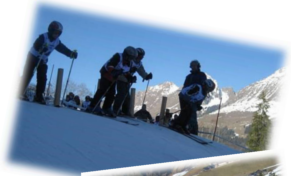
Départ en ligne