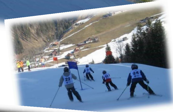
Après quelques mètres, une hiérarchie s'installe